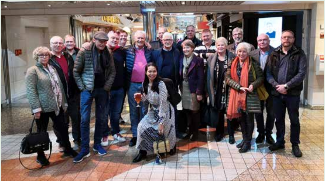
Deltakere fra 7 losjer blir enda bedre kjent på seilassen til Kiel 12.-14 oktober.

Losje Sølvstjernen stilte med hele 6 deltakere. Flere av deltakerne var med for første gang. Turen var organisert med tidlig ombordstigning med smørbrød servert i Observation Lounge øverst i båten med god utsikt. Deretter hadde vi reserverte plasser på Showet før selskapet litt senere inntok middag i Grand Buffèt. Søndag ble det samlet tur i nydelig vær til Løwenbrau for lunsj. Da følget var tilbake på båten ble det Champagne-treff i Observation Bar. Middag