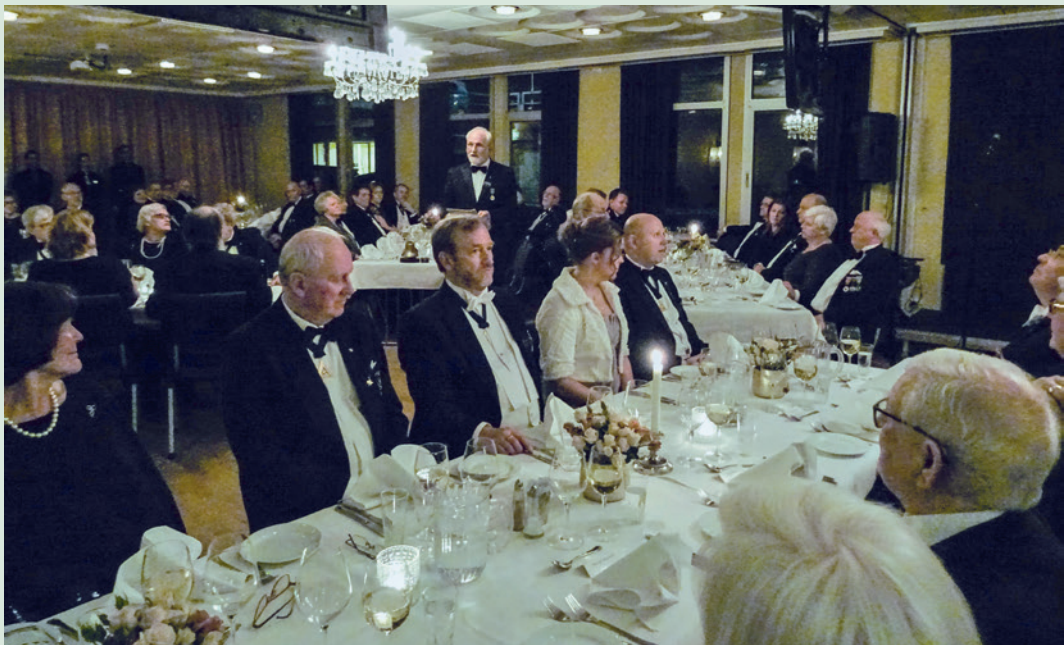
Fra festmiddagen på Grand Hotell.

Brødre fra Riksstorlosje, Storlosje, moderlosje, datterlosjer, vennskapslosjer og selvfølgelig egne brødre var innvitert til Losjehuset i Ellingersgt i Larvik kl. 15.30.