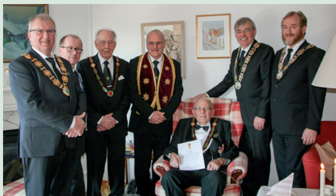
Stolt jubilant og smilende gratulanter hygger seg sammen.

Tekst og foto: Bibl. Knut Klemmetsby, losje Sagalund