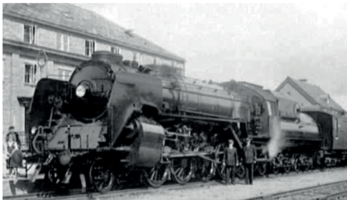
Dovregubben på Oppdal stasjon.

Av Eiliv Sandberg Losje Pastos og Gilde-sekretær