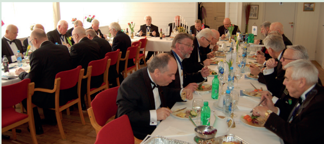
Summende prat og gode historier rundt langbordene under festmiddagen.

Tekst og foto: bibliotekar Gunnar Grotle losje Corona